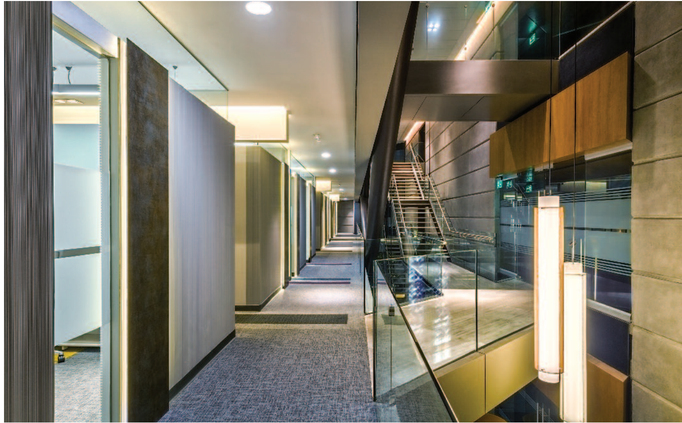
CORPORATIVO TORRE REFORMA Ciudad de México 2017